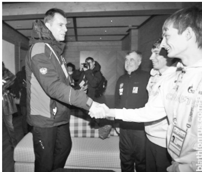
Во время сбора в Сочи спортсменов приветствовал президент Союза биатлонистов России Михаил Прохоров.