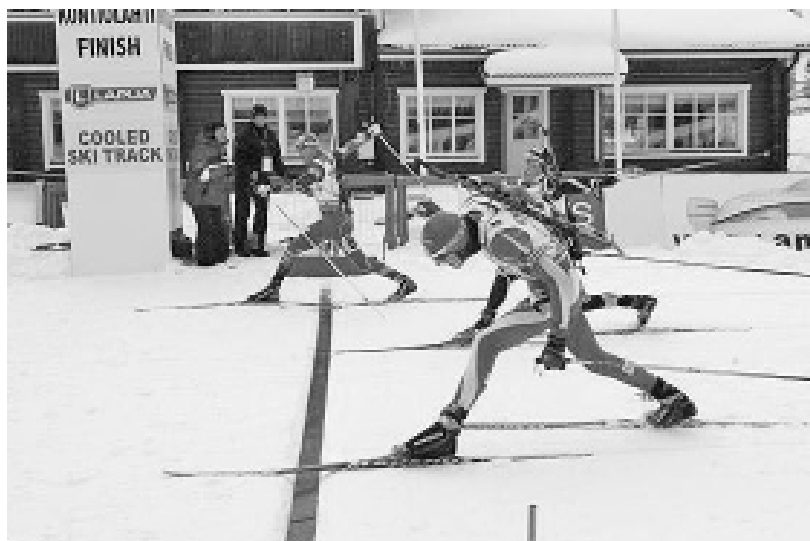
«Разножка» ценою в бронзовую медаль.

леть. (Справедливости ради надо заметить, что противостоял Илье на этом этапе уже известный на международной арене младший брат знаменитого норвежца Тарей Бё Йоханес – прим. ред.) Печенкин показал второй результат на своем этапе, Максим Цветков отработал здорово. Франция, Россия и Чехия финишировали синхронно. Призеры определили фотофиниш. Из-за пяти кругов штрафа и времени, использованного на дополнительные патроны, мы потеряли примерно