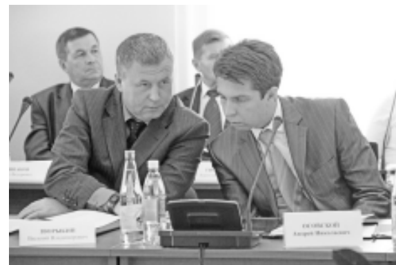
На заседании Совета представительных органов муниципальных образований области.

В Законодательном Собрании области состоялось заседание Совета представительных органов муниципальных образований области. В ходе работы Совета главы районов и представительных органов власти заслушали доклады о строительстве дорог на территории области, о создании контрольно-счетных органов на местах, о муниципальной реформе. Вопрос, который волнует все без исключения районы области – строительство дорог. В текущем году на Дорожный фонд области возлагались большие надежды - ведь его объем был значительно увеличен.