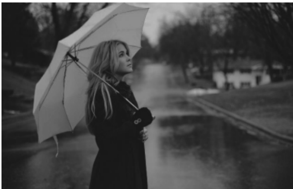
«По улицам дождя пойду печально и легко...»