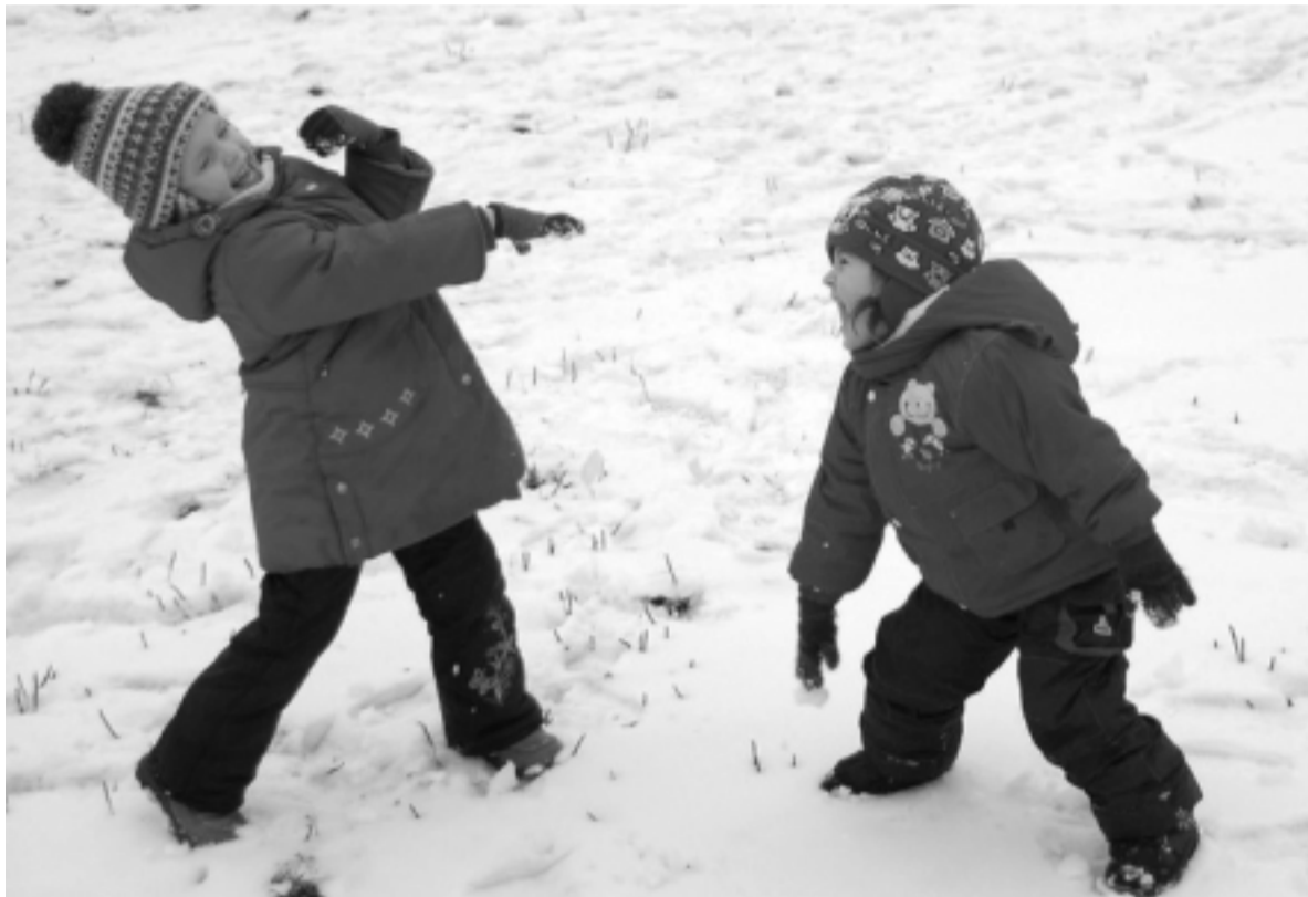
«Рады мы приходу мамушки-зимы...».