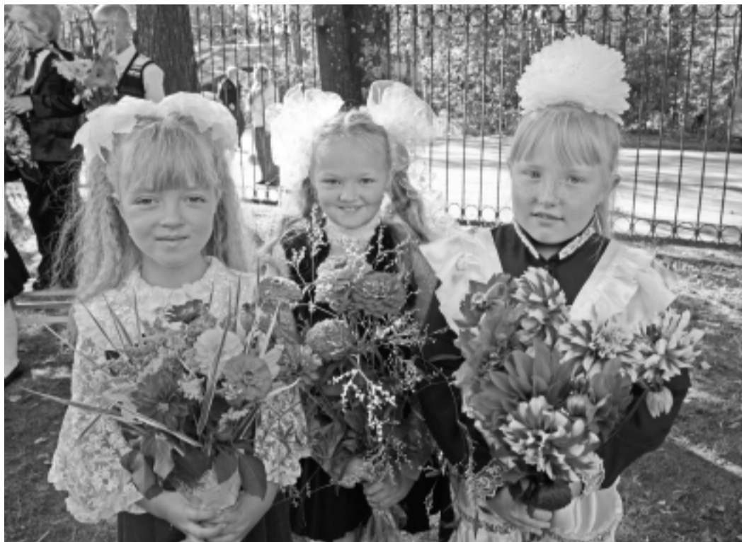
В школах района начался новый учебный год. За парты сели более двух тысяч учеников.