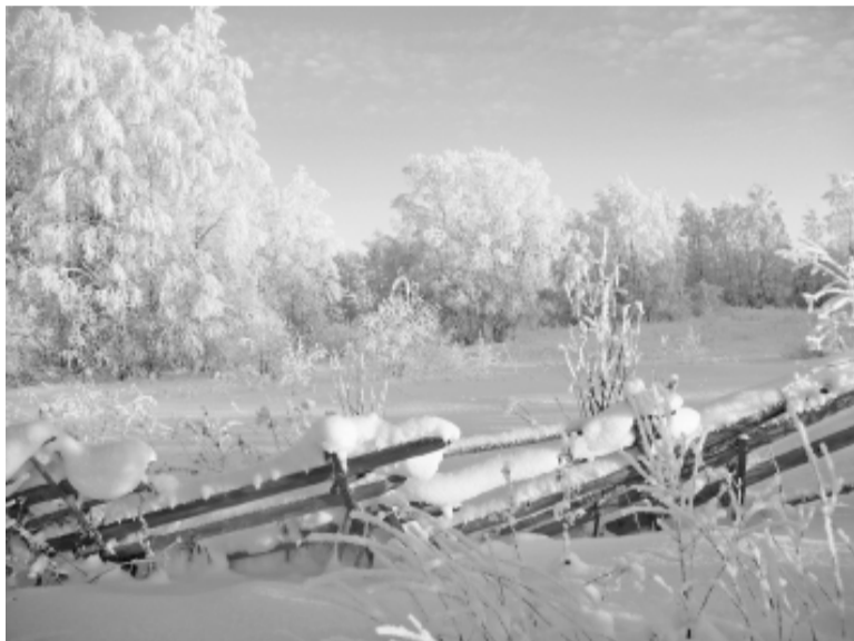
А зима уходит не хочет...