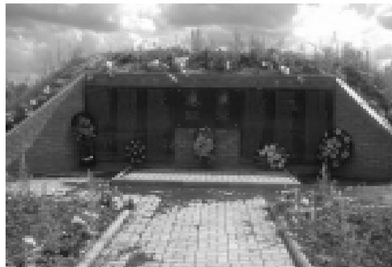
Памятник землякам, погибшим в годы ВОВ, в Комонева. Здесь планируется установить артиллерийское орудие.

Минкомсвязи подтверждает данные об увеличении сроков доставки и отмечает, что министерство сменило руководство почтовой монополии и провело модернизацию предприятия. В будущем от этих мер следует ждать изменения ситуации в лучшую сторону, заявил замминистра Михаил Евраев.