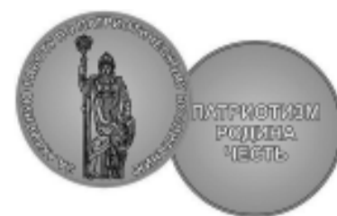
Почетный знак «За активную работу по патриотическому воспитанию граждан Российской Федерации».

Группа вологжан была награждена памятной медалью «Патриот России». А Бабаевское районное отделение Всероссийской общественной организации ветеранов (пенсионеров) войны, труда, Вооруженных Сил и правоохранительных органов удостоено почетного знака «За активную работу по патриотическому воспитанию граждан Российской Федерации».