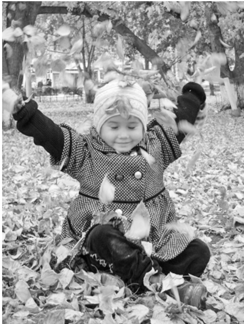
На ковре из желтых листьев.