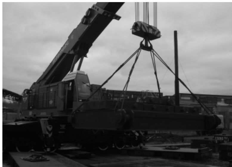
Под стрелой КЖ-971Б 100 тонн.

Приятно, что такой подарок мы получили в канун своего профессионального праздника. Я со своей стороны всем работникам и ветеранам-восстановителям хочу пожелать крепкого здоровья, профессионализма, семейного спокойствия и благополучия. С праздником, коллеги!»