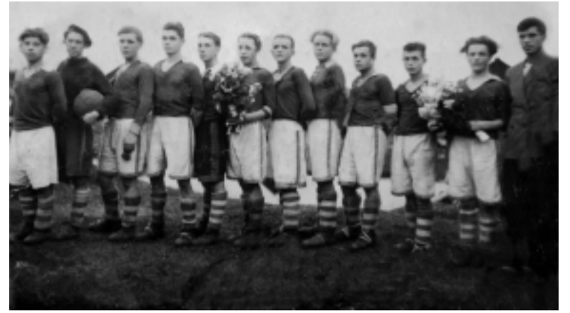
На снимке: футбольная команда ДСО «Локомотив», чемпион Бабаевского отделения Северной железной дороги. 1949 год.