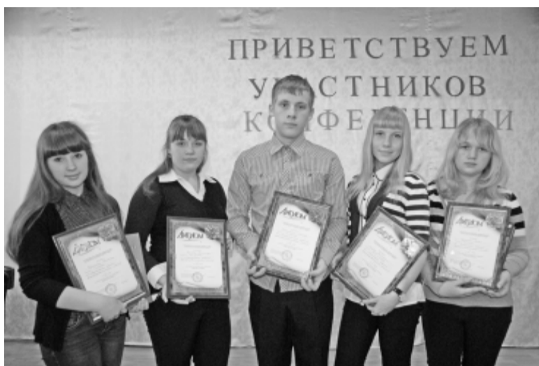
Пять участников конференции «Мир через культуру» признаны победителями и награждены дипломами и памятным призами.

Выбор темы – очень трудный этап. Тема – ракурс, в котором рассматривается проблема. Ребята совместно со своими наставниками постарались сформулировать её лаконично, а используемые при её формулировке понятия связали логически. Каждый из выступающих постарался обосновать,