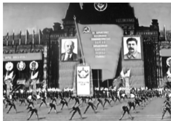
Парад физкультурников на Красной площади, 1945 год.