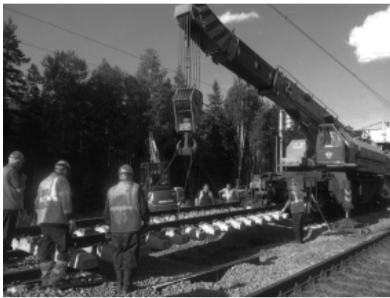
Работа ВП-4063 на замене мостов.

Приказ на выезд для устранения последствий схода нам поступил в 3.40. Начался активный сбор причастных к ликвидации. Время сбора основного штата восстановителей – в 3.50. Готовность поезда я дал в 4.05. Время отправления со станции Бабаево – 4.15, то есть через 35 минут после получения приказа. По нормативу отправиться мы должны были не позже чем через 40 минут. На место происшествия выехали 15 бабаевских восстановителей. Также туда экстренно отправили «автолечуку» на базе автомашины «Урал». Она выехала с места дислокации в 4.07. Расстояние до места происшествия 33 км. Средняя скорость передвижения поезда составила 55 км/ч. Немного подзадержались у станции Ти-