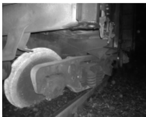
В таком состоянии находился неисправный вагон.