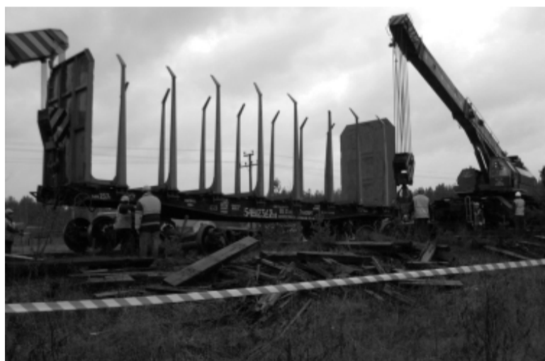
Бабаевские восстановители на полигонных учениях.

- Уже второй. Разница в том, что в предыдущем случае, а он имел место 15 января, мы не доехали до места схода. Абсолютно такая же ситуация случилась на перегоне Мыслино-Валя. Тогда параллельно с нами выезжал вос-