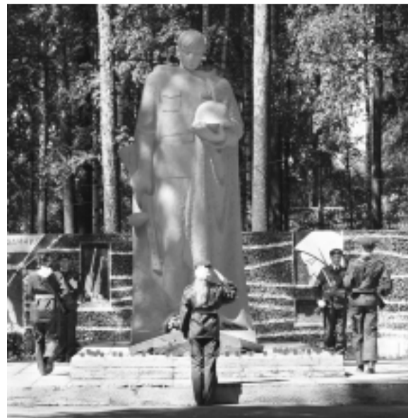
Смена Почетного караула.