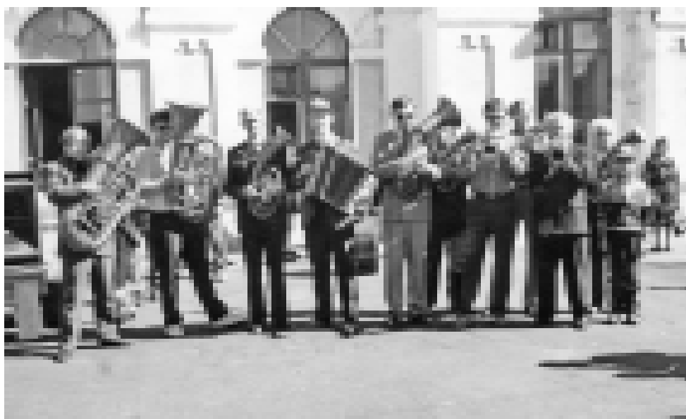
«Оркестр наш духовой...»