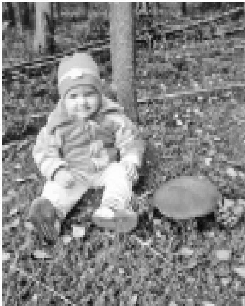
Пора по грибы!