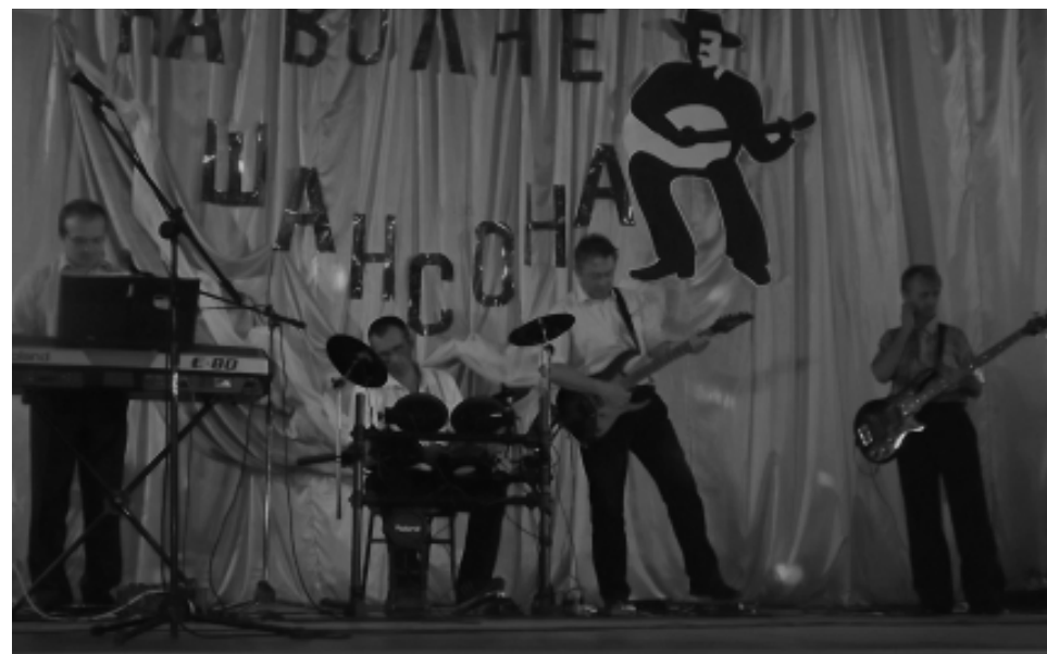
Обладатель второго места среди вокальных групп ВИА «Счастливый случай».