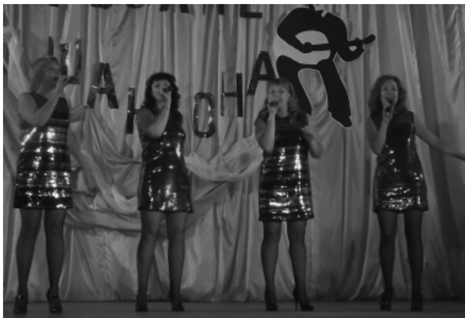
Группа «Овация» - обладательница приза зрительских симпатий и гран-при II межрайонного конкурса «На волне шансона».