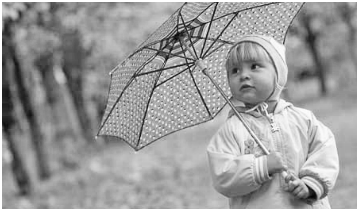
«Дождик, дождик, перестань...»