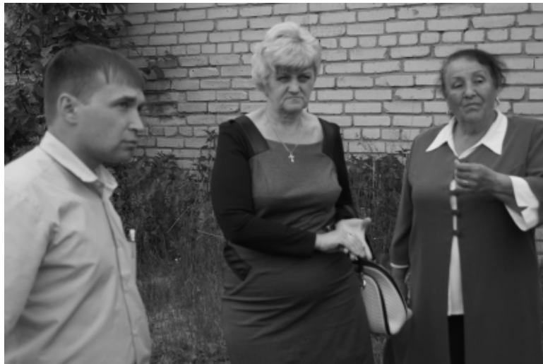
Идет обсуждение вопроса по восстановлению работы общественной бани в поселке Пяжелка.

Но, конечно, больше всего бабаевцев интересовало предварительное голосование за кандидатов в главы района. На эту должность были предложены две кандидатуры: первый замести-