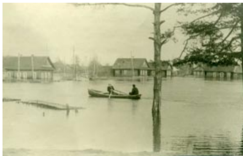
Паводок 1966 года, улица Шуганикова.

Недавно, разбирая фотоархивы Н.Г. Голубцова, обнаружил очень интересную фотографию, отражающую уровень наводнения, которое произошло в городе Бабаево весной 1966 года.