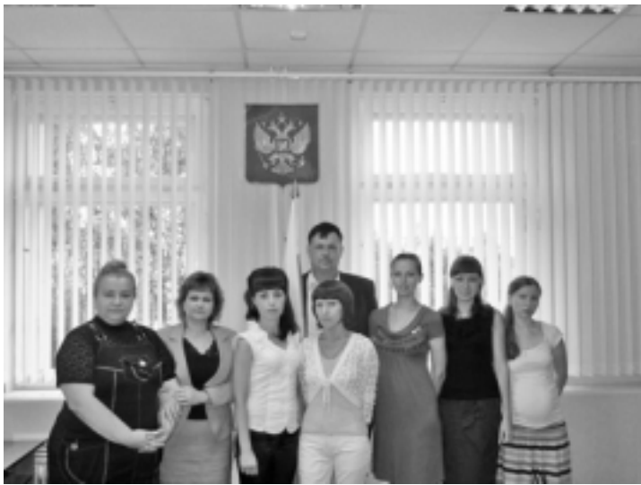
Коллектив суда (постоянного судебного присутствия) в п. Чагода.