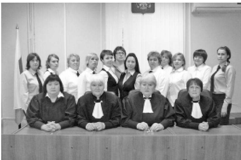
Коллектив суда (г. Бабаево):

Именно эту дату и принято считать днём образования Бабаевского районного народного суда, который подчинялся Череповецкому окружно-