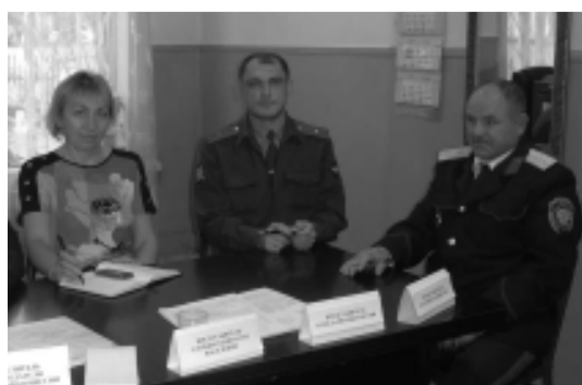
Призывная комиссия за работой.