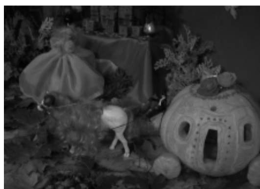
Композиция из сказки «Золушка» всех очаровала.