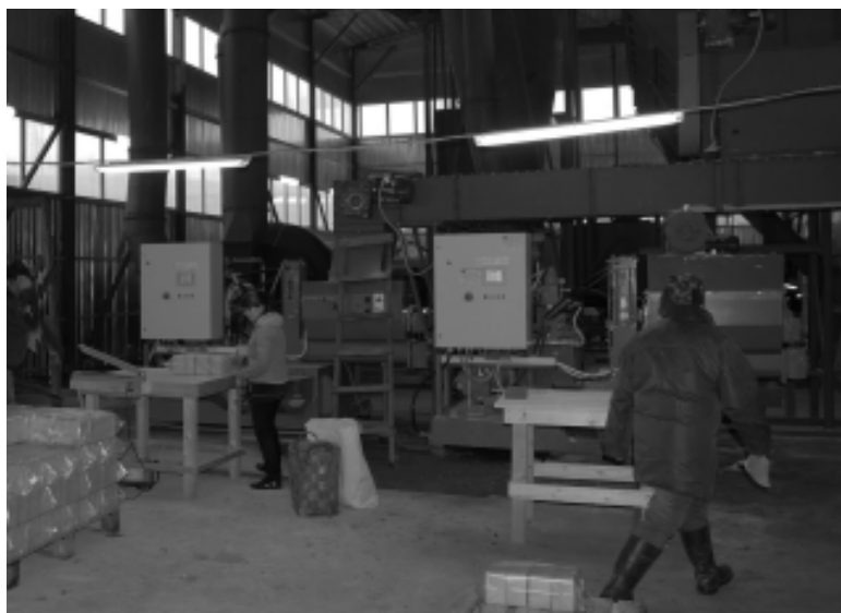
Одна из инвестиционных площадок - ЗАО «Суда».

- Визит был очень полезным. На основе полученных рекомендаций начнем заниматься развитием сельского туризма. Это направление очень перспективное, учитывая специфику нашего района. Но нужны люди, которые бы занялись реализаци-