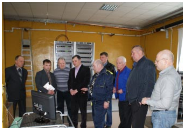
В Бабаевский район пришло цифровое телевидение. Пуск нового оборудования на Слудненской телевышке.