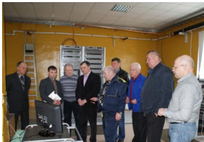
В Бабаевский район пришло цифровое телевидение. Пуск нового оборудования на Слудненской телевышке.