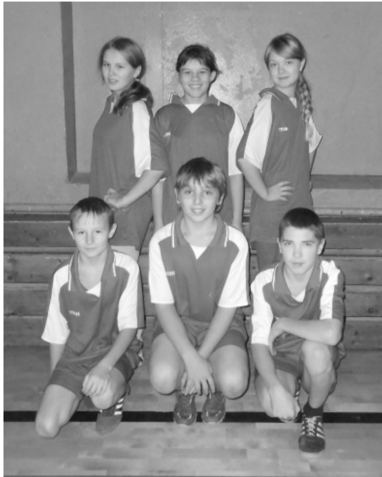
Победитель «Президентских состязаний» - команда Тимошинской школы.

Во второй части соревнований были проведены «Весёлые старты» - самый сложный по судейству вид. Эстафеты проводи-