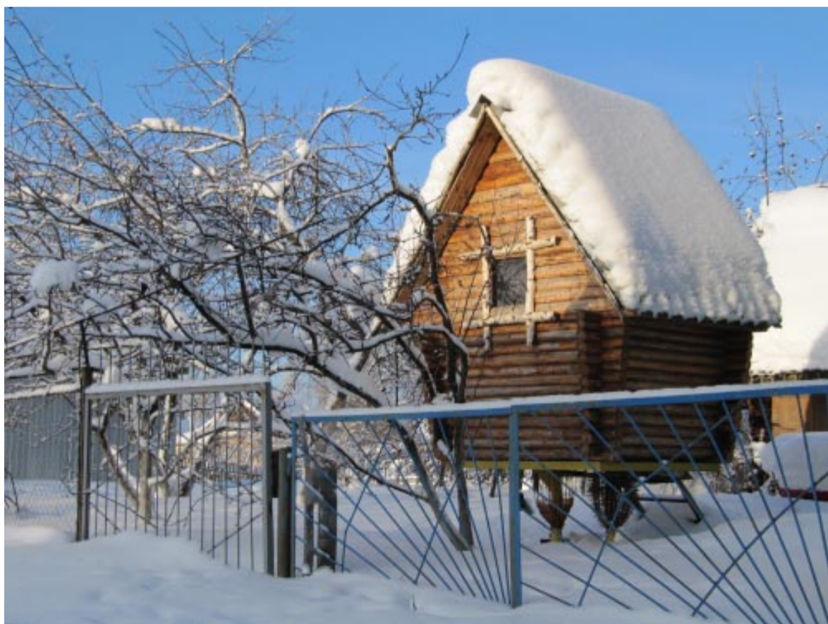
Фотографирует Галина Комарова.