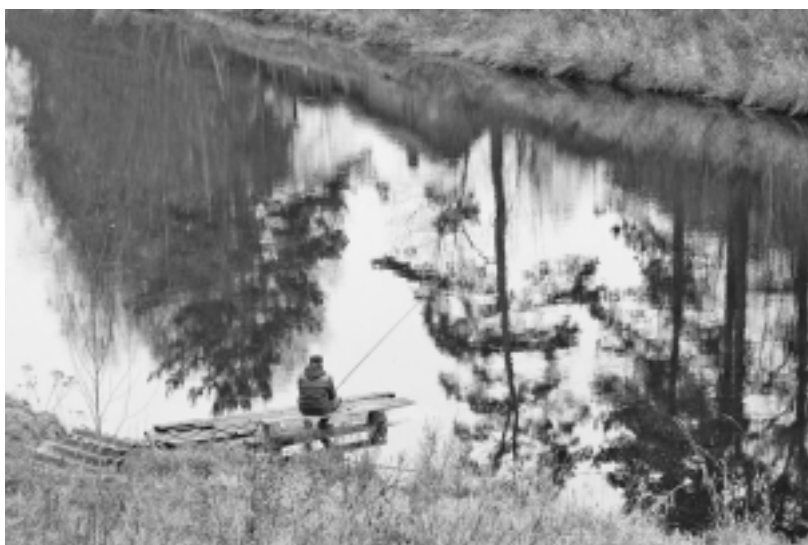
Вот и лето прошло... Деревня Торопово.