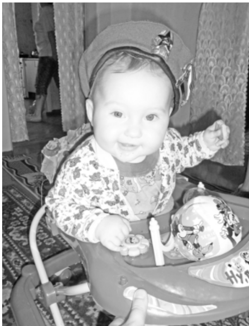
«Вперед, «голубые береты»!».