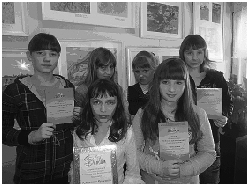
Лауреаты и дипломанты конкурса.

В декабре в выставочном зале Детской художественной школы г. Вологды работала выставка по итогам областного конкурса детского изобразительного творчества по станковой композиции «Мир детства» - «Поэтические музы Вологодского края». Работы лауреатов и дипломантов обучающихся Борисовской детской художественной школы и других школ области были представлены в экспозиции победителей всероссийского конкурса. Главной целью конкурса стало воспитание средствами изобразительного искусства интереса к творчеству вологодских поэтов, к истории и традициям родного края, формирование эстетических вкусов подрастающего поколения.