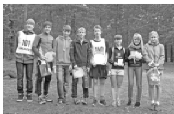
Выпускники ДЮСШ «Старт», выполнившие норму первого взрослого разряда.

Всего в соревнованиях приняли участие 152 воспитанника ДЮСШ. Это хорошее начало. Все коллективу школы в новом учебном году хочется пожелать высоких результатов и новых достижений.