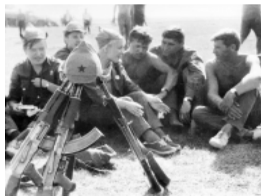
Боевая комсомольская юность. Отдых между «боями».

Мои комсомольские годы прошли на Бабаевской мебельной фабрике. Все мы, кто прямо или косвенно был причастен к славным делам комсомольцев и молодежи фабрики, это время не забудут никогда. Просто его забыть невозможно. Социалистическое соревнование, движение за коммунистический труд рождали в молодых производственников стремление к повышению производительности труда, его качества. Активность комсомольцев и молодежи ярко проявлялись в общественной работе.