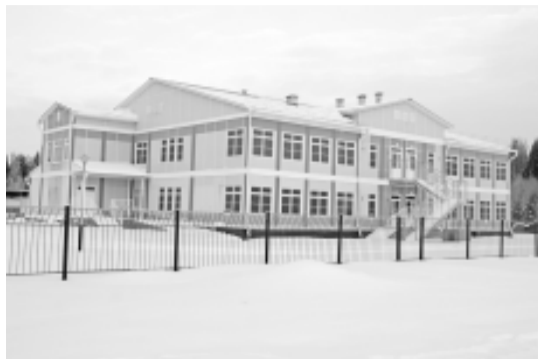
Детский сад появился в Бабаево на улице Свободы, 9.

Большинство детских садов в России - и Вологодская область не исключение - строилось еще в советские времена. С тех пор изменилось многое. Но главное осталось - к строительству и оснащению детских учреждений предъявляются самые строгие требования. Когда сотрудники Вологодского завода СКДМ начинали реализацию масштабной программы по возведению детских садов, они в деталях изучили все санитарные, пожарные и прочие нормативы и разработали проект, соответствующий всем требованиям. Проект прошел государственную экспертизу, и вологодское предприятие первым в России построило детские сады из быстровозводимых конструкций. Так в Бабаево за несколько месяцев появился 2-этажный детский сад, рассчитанный на 80 мест. За это время строители разработали участок, смонтирова-