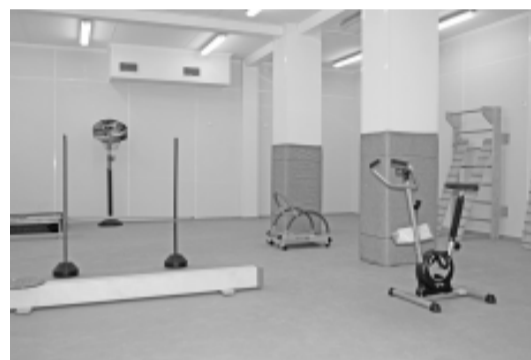
В физкультурном зале детского сада уже установлено спортивное оборудование.

производства, он является прочным, пожаростойким и не выделяет вредных веществ.