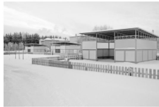
На этих участках скоро будут гулять бабаевские малыши.

Санитарная норма помещений - 6 кв. метров на ребенка - соблюдена при проектировании и строительстве. В туалетных комнатах сантехника подобрана и установлена с учетом роста малыша. Современная детская мебель - удобная и