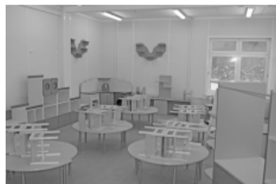
Специальная мебель для детей подбиралась с учетом их возраста.