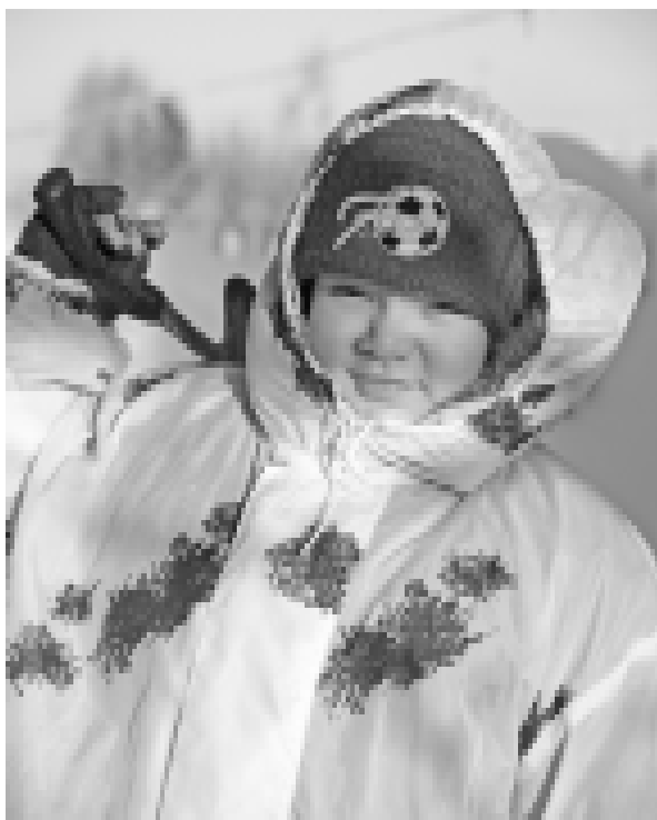
«Портрет в интерьерах зимы».