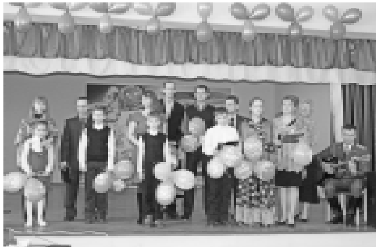
С юбилеем школу поздравили выпускники.