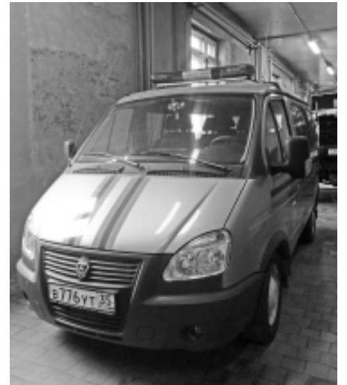
Специальный штабной автомобиль на базе автомашины «Соболь».

-Для успешной работы у нас есть все – и силы, и средства, - уверен заместитель начальника пожарной части Алексей Свинцов. – Сегодня личный состав 6-го отряда ФПС насчитывает 26 человек. Ежедневно на дежурство заступают 6 человек, из них 2 водителя, 4 пожарных и 2 офицера. В боевом расчете постоянно задействованы две пожарные автоцистерны, еще одна находится в резерве на случай, если на месте происшествия пожарным потребуется дополнительная помощь. Осенью прошлого года в наш автопарк прибыло «пополнение» - нам был выделен специальный штабной автомобиль на базе автомашины «Соболь» со всем необходимым оборудо-