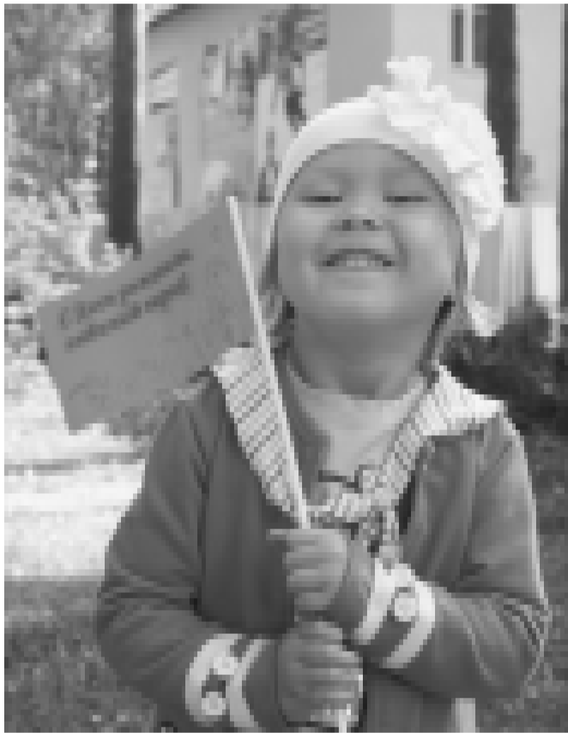
Уважаемые горожане – жители города Бабаево!

В преддверие праздника – Дня города - необходимо оглянуться назад, сделать оценку проделанной работе за год.