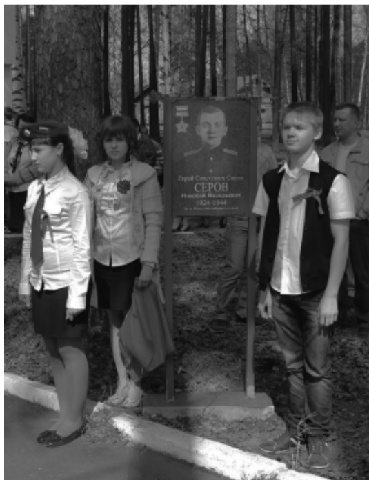
2013 г. Открытие Аллеи Героев Советского Союза.

Шли годы. Менялся Привокзальный парк, менялся облик воинского мемориала, совершенствовались формы патриотического воспитания горожан и подрастающего поколения. 6 мая 2011 года на воинском мемориале было многолюдно. Сюда пришли школьники, ветераны войны и труда, пенсионеры. В этот день здесь в память о земляках, погибших на фронтах Великой Отечественной войны в торжественной обстановке был зажжен Вечный огонь Славы. В той торжественной церемонии принимали участие: глава го-