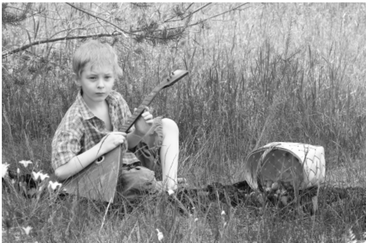
Эх, калинка, калинка моя, в саду ягода малинка моя...