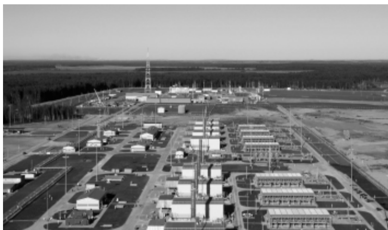
КС-21 Шексна: общий вид КЦ-3 и КЦ-4.

Ну а в декабре была введена в эксплуатацию новая система управления компрессорными станциями «Шекснинская» и «Бабаевская», что еще больше повысило степень автоматизации и компьютеризации газопроводов. Тогда же, в декабре, при участии губернатора области Олега Кувшинникова на шекснинской земле был зажжен символический факел, ознаменовавший собой окончание строительства межпоселкового газопровода-отвода Чуровское-Чаромское-Сизьма. Газ для новых