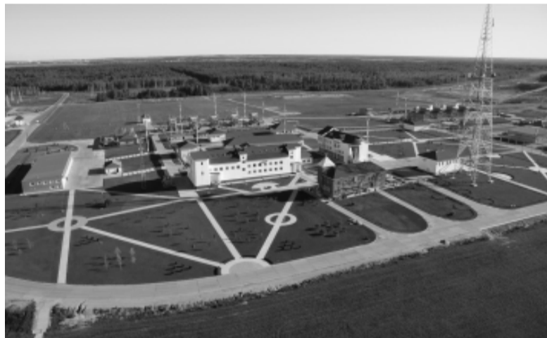
КС-21 Шексна: общий вид КЦ-1 и КЦ-2.

Ну а пока весь коллектив Шекснинского ЛПУ МГ принимает заслуженные поздравления и готовится отметить свой 35-летний юбилей новыми успехами и свершениями. Тем более, что по человеческим меркам, 35 лет – время самого расцвета. А значит, все лучшее и интересное у шекснинских газодобывателей еще впереди!