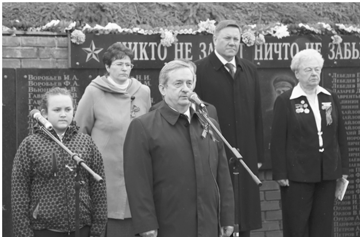
5 мая 2014 года состоялась торжественная церемония установки дивизионной пушки в деревне Горка сельского поселения Вепское национальное на мемориале воинской славы.

Председатель Законодательного Собрания области Г.Е. Шевцов взял под личный контроль вопрос передачи в собственность Бабаевского муниципального района артиллерийского вооружения для установки в качестве памятника.